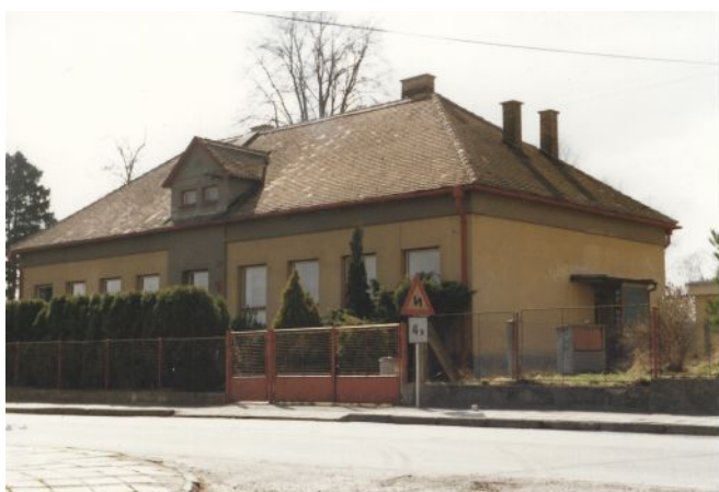
Budova mateřské školy někdy po roce 1980