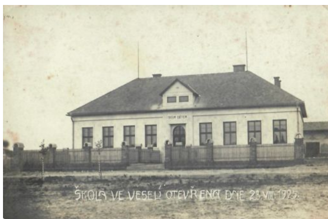
Pohlednice z roku 1925 vydaná u příležitosti otevření nové budovy Obecné školy Veselí ( vlevo školní třída, vpravo byt učitele)

zpracovala: Mgr. Jitka Danihelková kronikářka obce