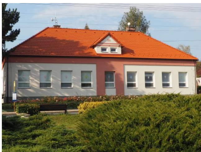
Současná podoba mateřské školy po roce 2019